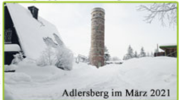
Adlersberg im März 2021

Zahlreiche Vereinsmitglieder nutzten auch die außergewöhnlichen schönen Wintertage, um