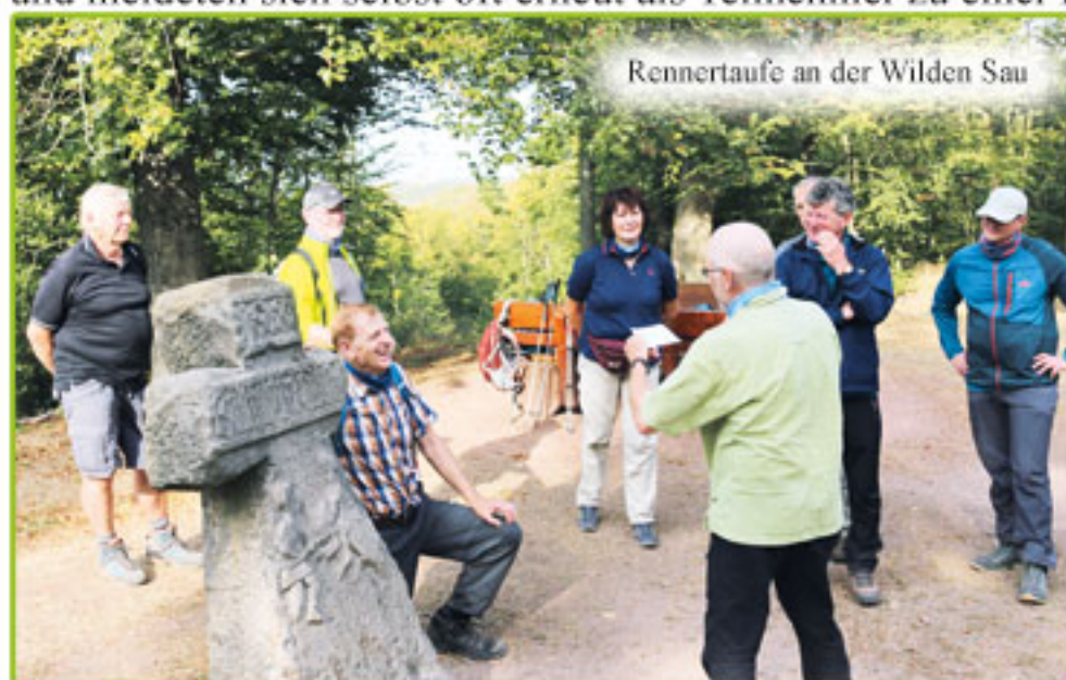
Rennertaufe an der Wilden Sau