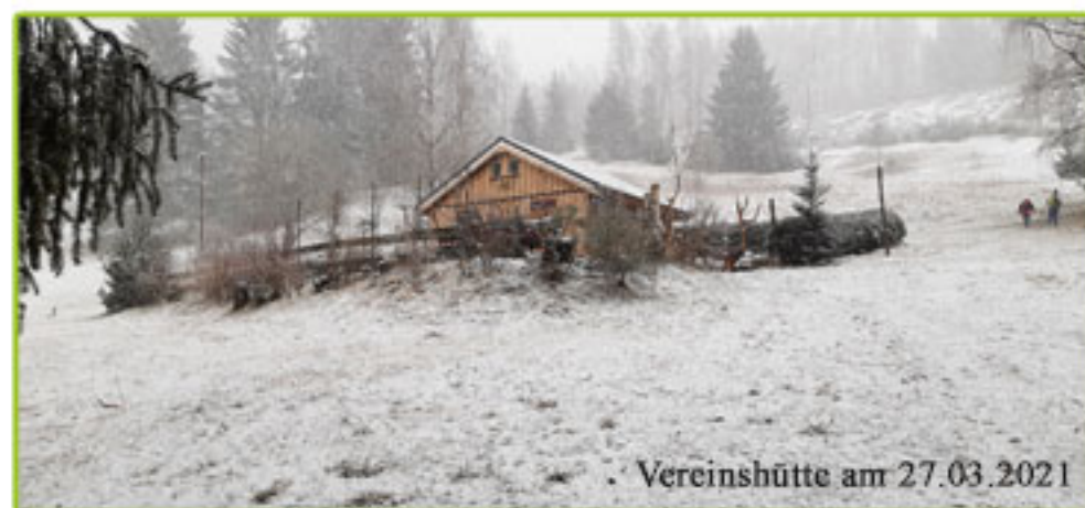
Vereinshütte am 27.03.2021

Unsere Handwerkerbrigade erledigte weitere Arbeiten an der neuen Außenverkleidung und die „Gärtnerinnen“ begannen mit ersten Arbeiten im Steingarten.