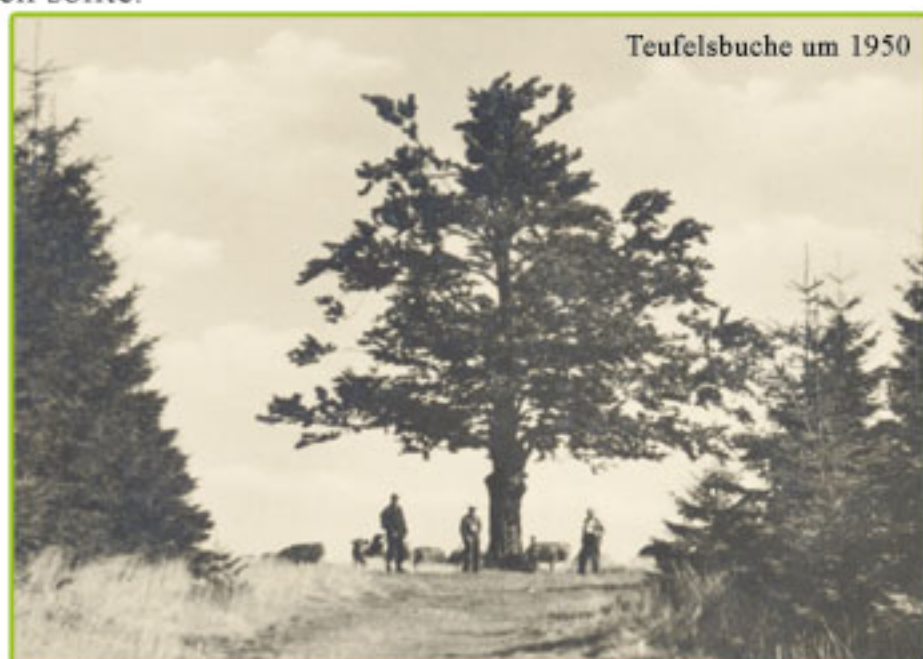
Teufelsbuche um 1950

Man startete schon am 2. Juni, 6:55 Uhr, um am Abend im Waldhaus die Jahreshauptversammlung durchzuführen.